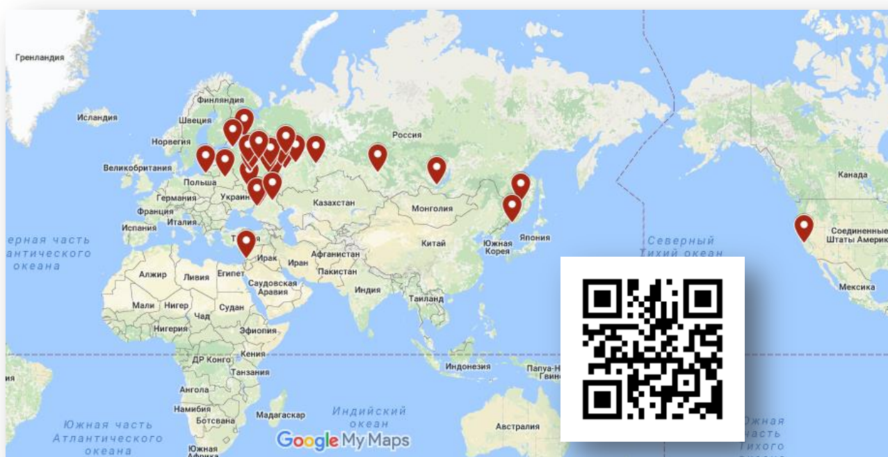
Рис. 1. Карта участников Форума